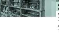
Gartenbelz Nutzung - separates Familienbereich