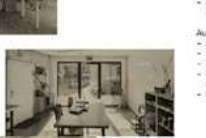
Rezeption Abtrennung Glas für Sichtbarkeit Work, Sozialer Raum, Restaurant