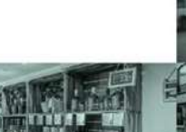
Pop-up Stores, Mini-Markets Nutzung - fixe Veranlassung - flexible Veranlassung