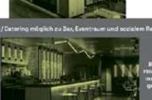
Bar Nutzung - Durch Barkeeper oder Im- nahmen von Events - Bargruppe kann gestaltet werden - Bar selber betreiben, Lager bestand zu Einkaufspreis + and zur Verfügung gestellt