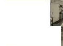
Werkstätten Nutzung - Holz, Metall-Workshop, Fablab, etc.