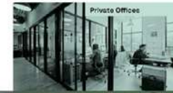
Private Offices Nutzung - Langzeitvermietung - Auf Coworking, Mitglieder