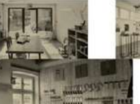
Werkstätten Nutzung - Holz, Metall-Workshop, Fablab, etc.