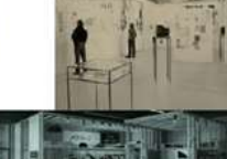
Foyer / Sozialer Raum Nutzung - Begegnung durch mehrere Organisationen, - Vormittag Familienhelfer bis 11:00 Uhr durch Verkauf ab 12:00 Mittagspause durch mehrere Vereine - ab 14:00 - - ab 17:30 Teeny-space