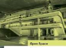
Open Space Nutzung - nur für Mitglieder - Coworking und Motor 1. OG