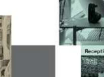
Werkstätten Nutzung - Holz, Metall-Workshop, Fablab, etc.