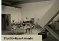
Studio-Apartments Nutzung - Langzeitvermietung - Mithilfe von Angebot - Vergünstigte Miete bei Mi- arbeit