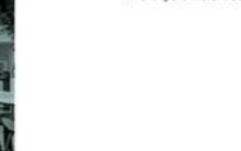
Restaurant Zugang Restaurant