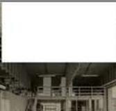
Atelier-Räume Nutzung - Fixe Veranlassung an Kunst- und Kulturschaffen- de, Business, etc. - Freie Ateliers für zeitliche Veranstaltungen und zeit- weise Veranlassung