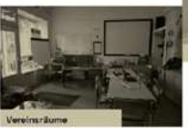
Foyer / Sozialer Raum Nutzung - Begegnung durch mehrere Organisationen, - Vormittag Familienhelfer bis 11:00 Uhr durch Verkauf ab 12:00 Mittagspause durch mehrere Vereine - ab 14:00 - - ab 17:30 Teeny-space