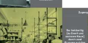
Foyer / Sozialer Raum Nutzung - Begegnung durch mehrere Organisationen, - Vormittag Familienhelfer bis 11:00 Uhr durch Verkauf ab 12:00 Mittagspause durch mehrere Vereine - ab 14:00 - - ab 17:30 Teeny-space