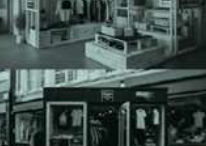
Pop-up Stores, Mini-Markets Nutzung - fixe Veranlassung - flexible Veranlassung