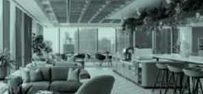
Rezeption Abtrennung Glas für Sichtbarkeit Work, Sozialer Raum, Restaurant