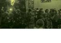
Gartenbelz Nutzung - separates Familienbereich