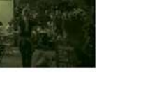
Gartenbelz Nutzung - separates Familienbereich