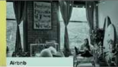
Airbnb Nutzung - Kurzzeitvermietung