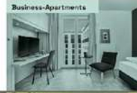
Business-Apartments Nutzung - Langzeitvermietung - Auf Coworking, Mitglieder