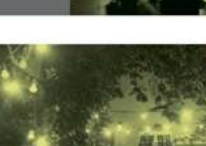
Kinderbetreuung Nutzung - Stundentage - online buchbar