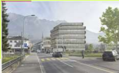
Gerwände auch Baurechtsanträge Weiteres Grossprojekt im Schaaner Zentrum geplant Die Gemeinde Schaan sucht Baurechtsanträge, die im Zentrum ein Dienstleistungsgelände erstellen. Der Gestaltungsplan gibt es bereits.