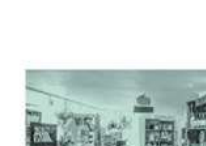
Pop-up Stores, Mini-Markets Nutzung - fixe Veranlassung - flexible Veranlassung