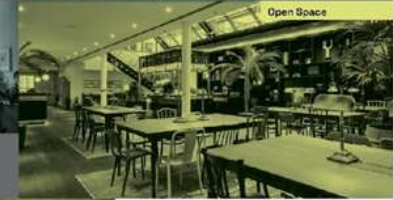
Open Space Ausstattung - Lounge - Tische - Hochtische - Kaffee / Tee Bar - Selbstbedienung - Laifig-Ladestationen