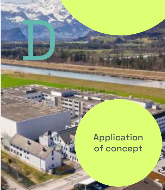
Development of the Site