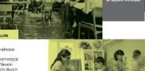
Pop-up Stores, Mini-Markets Nutzung - fixe Veranlassung - flexible Veranlassung